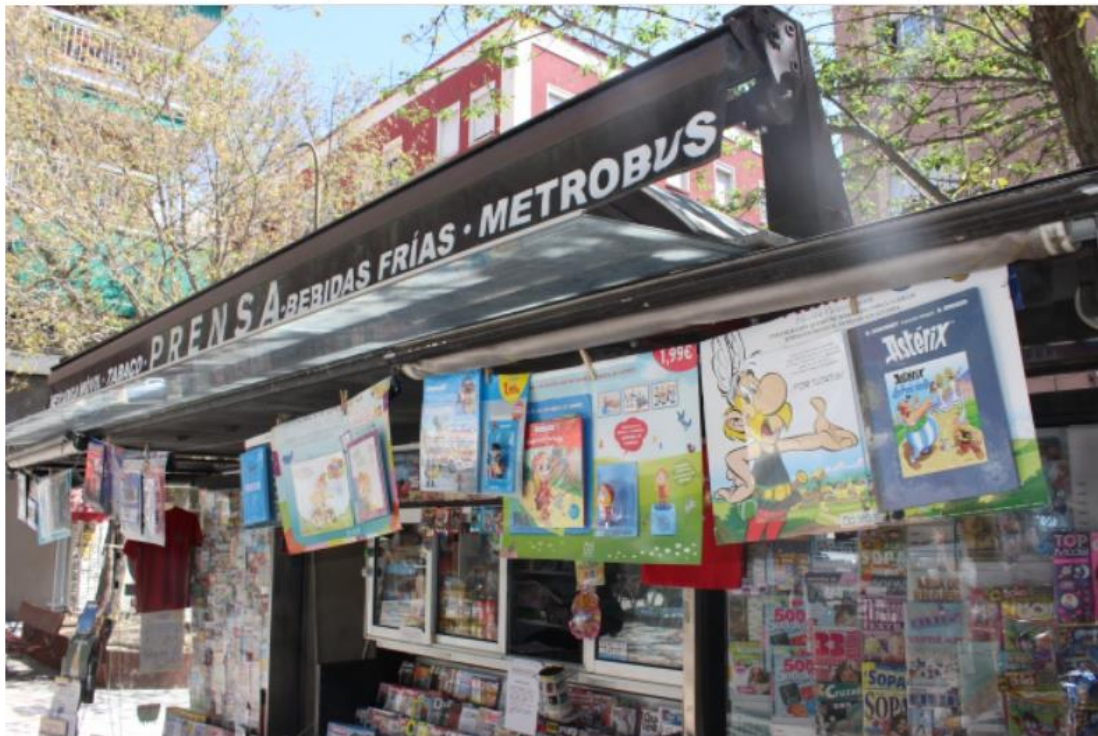
En el quiosco de la plaza de la Reverencia de Madrid hay muchos coleccionables. Verne

EMILIO SÁNCHEZ HIDALGO - 7 SEP 2019 - 15:12 CEST